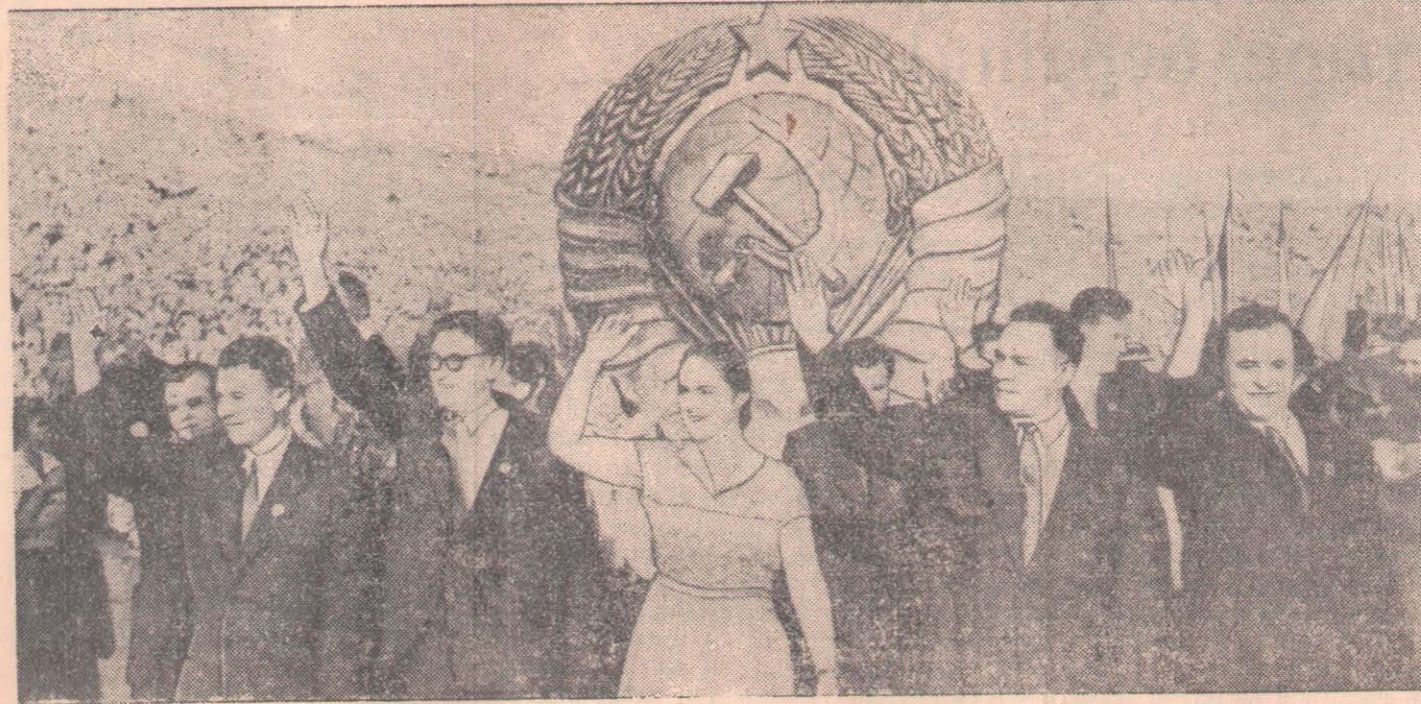
Варшава. Жастар мен студенттердің бейбітшілік пен достық жолындағы Бүкіл дүниежүзілік фестивалінде. СУРЕТТЕ: ССРО жастарының делегациясы Онжылдық стадионында.

Ауыл шаруашылығының кәзіргі заманғы машиналармен жабдықталуының өсуі оның өнімділігінің артуына себеп болады. Экспорттың сыйпаты мықтап өзгерді: Югославияның тек шикізат пен жартылай фабрикаттарды шетке шығаратын