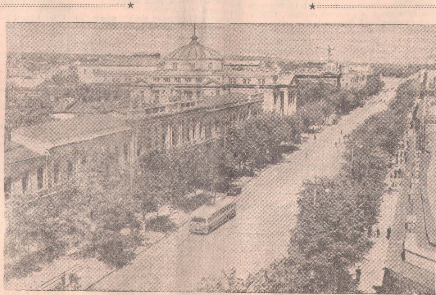
Молдаван ССР. Кишиневтағы Ленин атындағы проспект.