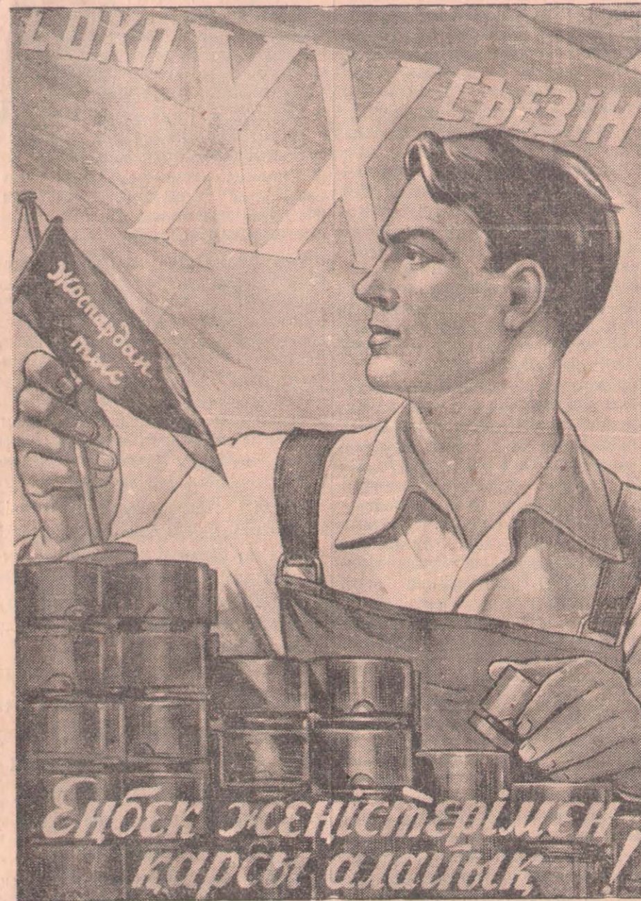
Бейнелеу искусствосының Мемлекеттік баспасы шығарған суретші В. Корец-

Ленин аудандық өндіріс комбинатының коллективі бесінші бесжылдыққа белгі-