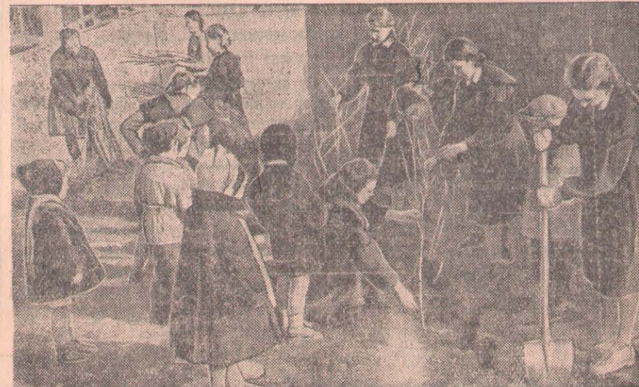
Қаладағы Молотов атындағы № 4 орта мектептің оқушылары Париж Коммунасы атындағы балалар бақшасын қамқорлыққа алған-ды. Көзір олар балалар бақшасының үй іргесін көгалдандыру мақсатымен ағаш отырғызуға кірісті. Мұнда барлығы 70 түп ағаш отырғызылады. Оқушылар өз тұқымдарымен 300 шаршыметр жерге әртүрлі гүлдер және ояңы егуді ұйғарып отыр. СУРЕТТЕ: 8 «В» және «Д» кластарының оқушылары оқытушы О. Бурцеваның басшылығымен балалар бақшасының қорасына ағаш отырғызып жүр.