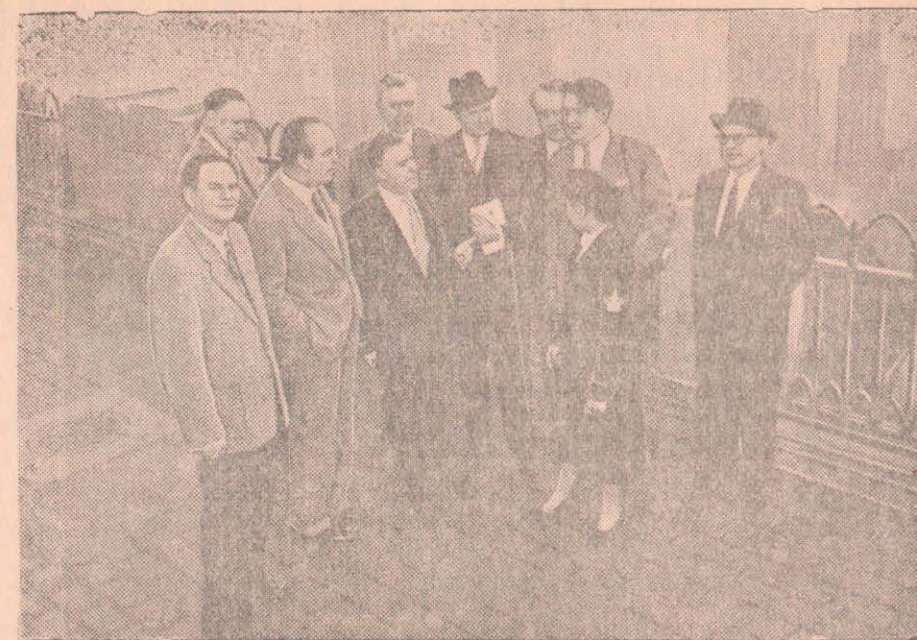
Біріп совет журналистерінің АҚШ-та болуы. СУРЕТТЕ: совет журналистерінің зәулім үйлердің бірінің төбесіне шығып, Нью-Йоркті қарап тұрған кезі.

Совет делегациясы, деп мәлімдеді Молотов қорытындысында, былай деп санайды: біз осы кеңесте кейбір мәселелер жөнінде,