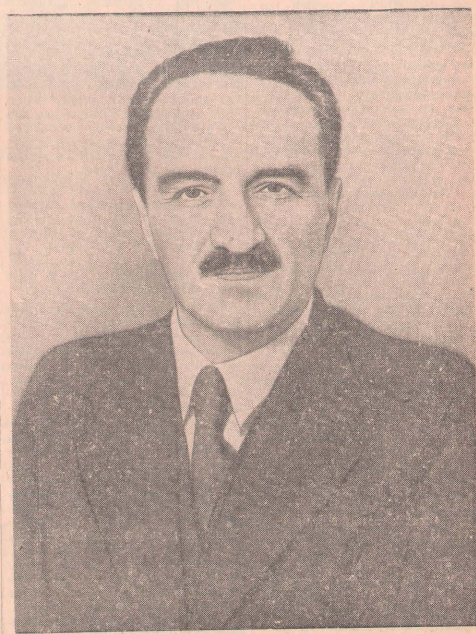
А. И. МИКОЯН.

Махараджаға сыйлығы үшін алғыс айта келіп, Н. С. Хрущев былай деді: «Бұл сыйлықты мен символикалық, достық белгі ретінде сақтаймын. Бұл әдемі семсерді көргенде маған мынадай ой келді: біздер совет адамдары, былай деп пайымдаймыз. Бала туғанда қамқорлықпен бағын күтуді біреке етеді. Егер оны күтімсіз қалдырса, егер оны қорғасыз қалдырса, егер оның