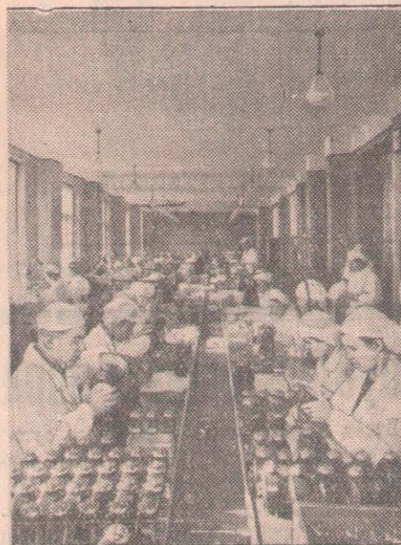
Дондағы Ростовта жаңа сағат заводы пайдалануға берілді. Коллектив 31—Б марналы будильниктер шығара бастады. Құрастыру цехының конвейерінен смена сайын 500-ден астам осындай сағаттар шығарылады.