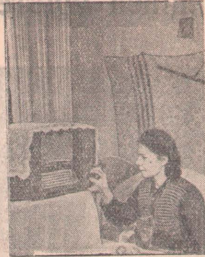
Облысымыздағы жаңадан ұйымдастырылған Черкасск астық совхозында.

Мәдени мекемелер ауыл-село мәдениетінің орталығына айнауда. Бұларда ағымдағы мәселе жөнінде және ауыл шаруашылығы тақырыптарында сұрақ, жауап кештері өткізіледі және түрлі тақырыпта лекциялар оқылып тұрады. Кітапханалардың кітап қоры өскен сайын кітап оқушылар саны да көбейе түсіп отыр.