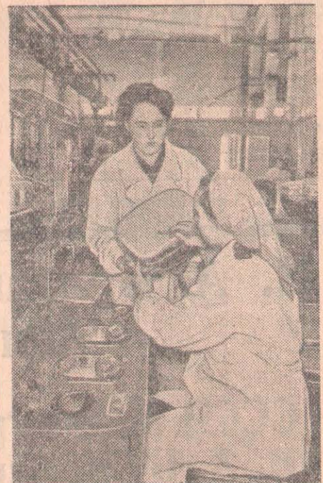
Москваның әртүрлі жүйедегі телевизорлар үшін электрон сәулелі түтіктер шығаратын электр лампалары заводы тік бұрышты экранды электрон сәулелі жаңа түтіктерді сериялап шығаруға әзірленуде.

Облыстың партия ұйымдарында партия оқуындағы кемшіліктерді жоюдың барлық мүмкіншіліктері де бар. Жоғарыда көрсетілген бірқатар жақсы мысалдар партиялық насихаттың идеялық мазмұнына әрдайым көңіл бөліп отырған жағдайда теорияны практикамен тығыз байланыстыруға, коммунистер мен барлық кадрларымыздың теорияны үйренуге ынталылығын арттыруға, ал саяси оқуды шаруашылық және мәдени құрылыстың бүкіл