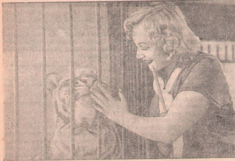
«Жолбарысты үйретуші» фильмінен кадр.