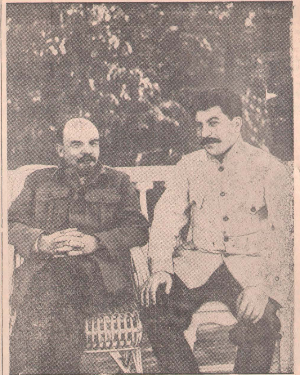
В. И. Ленин мен И. В. Сталин Горькиде.

Ленинизм кәзір, оның негізін данышпандықпен салушы кеменгердің тірі кезіндегідей, тек теория ғана, теорияның жүзеге асуының бастамасы ғана болып отырған жоқ; ленинизм кәзір барлық іспен біте қайнасақ, нақты өмірдің шындығына айналып отыр. Марксизм-ленинизмнің жеңімпаз идеяларының салтанаты