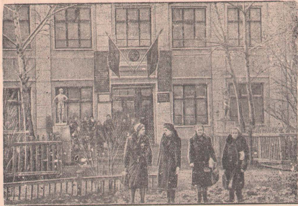
Суретте: Қаладағы В. И. Ленин атындағы № 1 орта мектеп.

1918 жылғы Совет үкметі Москваға көшкен күнге дейін В. И. Ленин тұрған