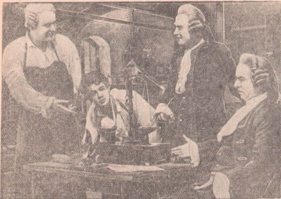
«Михайло Ломоносов» фильмінен кадр.

«Москва университеті өзінің бүкіл тарихының өн бойында ғылыми және педагогикалық кадрлар даярлауда, отандық және дүниежүзілік ғылымды дамытуда маңызды роль атқарып келеді» деп атап көрсетті СОКП Орталық Комитеті мен ССР Одағы Министрлер Советі университеттің құрылғанына 200 жыл толуына байланысты құттықтауында. Орыстың ең қарт, ең ірі жоғары оқу орны, дүние жүзі ғылымының ең үлкен орталығы Мәскеудің көк орденді университетінің даңқты мерекесін совет ғылымы мен мәдениетінің зор салтанатты мерекесі ретінде атап өткен совет халқы бұл күндері осы ғылым ордасының негізін алғаш қалаған орыс ғалымдарының атасы, ұлы оқымысты Михаил Васильевич Ломоносовты асқан зор құрметпен, аса күшті алғыс сезіммен еске алып, құрметтейді. Бәзір облыстың киноэкрандарында көрсетіліп жатқан «Михайло Ломоносов» атты көркемсуретті фильм де бұдан екі ғасыр бұрын дүниежүзілік ғылым шыңына көтерілген ұлы ғалымға арналған. Фильм сценарийін жазған Л. Рахманов, қоюшы Александр Иванов, операторлары М. Магид пен Л. Сокольский, музыкасы композитор В. Пушковтікі. Фильм 1955 жылы Ленин орденді «Ленфильм» киностудиясында жасалған.