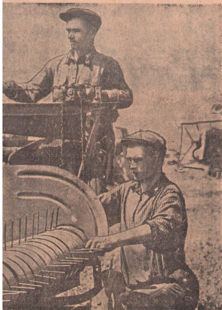
Механизаторы Советской МТС гото- вится к раздельной уборке урожая на