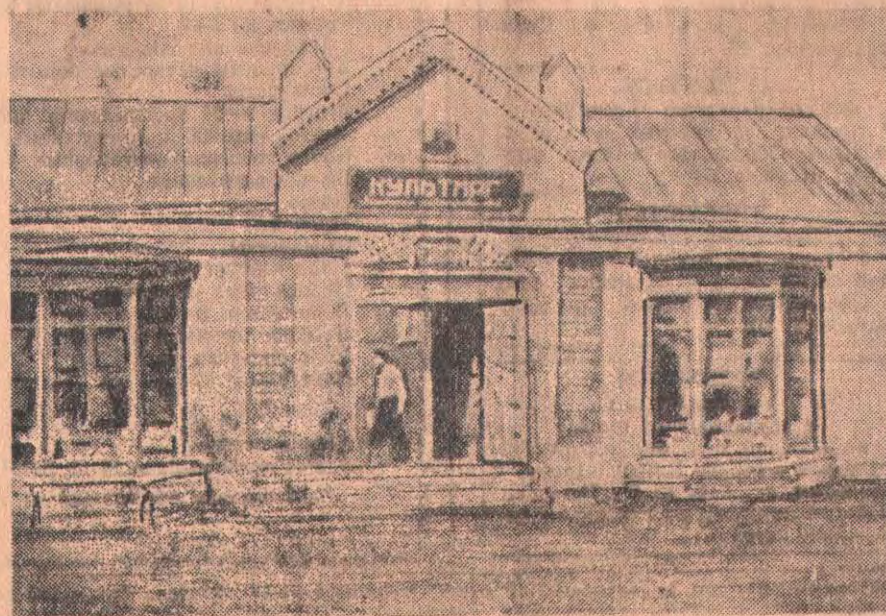
На снимке: новый культмаг Ленинского райпотребсоюза в Явленке.

Дидикиной З., работавшей совхозрабкоопе, о Воскобой правленной на работу сельпо, Булаевского рай других.