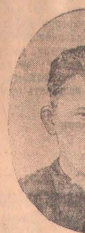
А. И. Иван комбайн