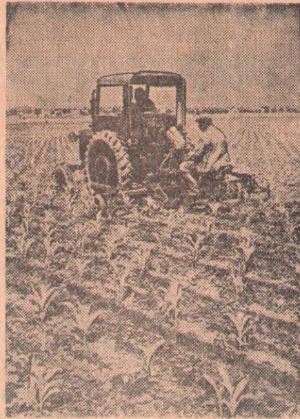
Чехословацкая Республика. На полях государственного хозяйства Велке Павловице.

Важным показателем новых настроений в Дании может служить также реакция общественности на успешное завершение советско-датских торговых переговоров. «Все население Дании с удовлетворением приветствует возобновление нормальной торговли с нашим великим соседом», — пишет газета «Социал-демократен» в своем