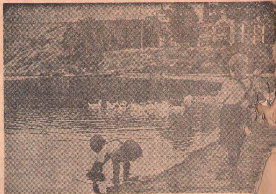
На берегу Ишима.

Пленум Центрального Комитета Венгерской партии трудящихся шлет горячий братский привет Коммунистической партии Советского Союза и ее ленинскому Центральному Комитету. Для Венгерской партии трудящихся неоценимой помощью является мудрая, продуманная, смелая политика, проводимая Коммунистической партией Советского Союза и ее Центральным Комитетом в интересах строительства коммунизма, защиты мира, ослабления