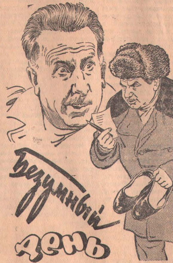
Производство киностудии «Мосфильм», 1956 г.