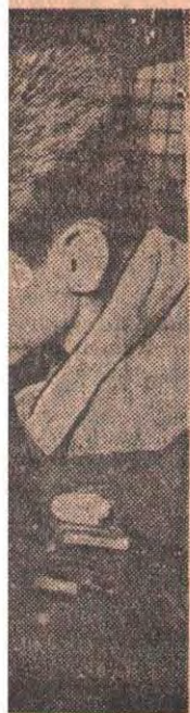
ственной и проф. й Республике. Генри Пельса в

В числе отдельных изданий—четыре-томник «Русских сказок» А. Афанасьева, три тома русской сатиры, русские пословицы, сборники произведений советских поэтов, прозаиков, очеркистов; в план включены издания произведений М. Кольцова, В. Гириона, Б. Ясенского и других авторов. Широко представлена зарубежная литература. Выйдет более двухсот названий книг иностранных авторов, общий тираж их произведений—27,5 миллиона экземпляров. (ТАСС)