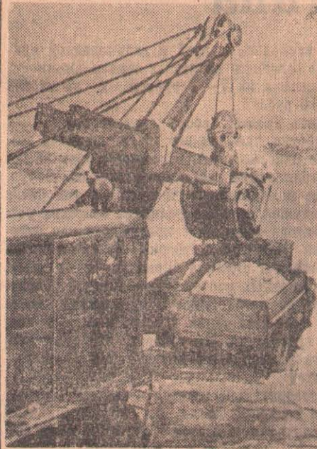
С фотоаппаратом по родной стране

Гурьевская область. На Индерском боратовом руднике вступил в строй пятый по счету эксплуатационный участок № 95, являющийся первенцем шестой пятилетки. По запасам руды он является самым мощным на Индере.