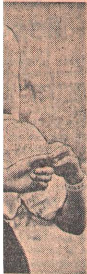
Их—непрерывных. На снимке: мать десятилетнего мальчика.

Когда начались финальные встречи на рапирах среди мужчин, зал Дворца физкультуры общества «Крылья Советов» был переполнен. Вызывают команды Украины и Российской Федерации (сборная област-