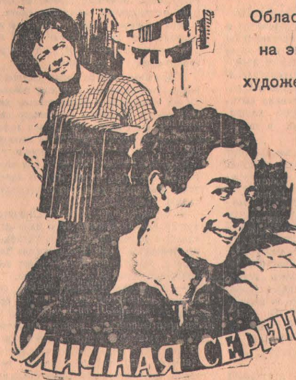
Производство «Нойс Эмелка—Вилли Цайн фильм»

Сегодня паломники отбыли в Советский Союз.