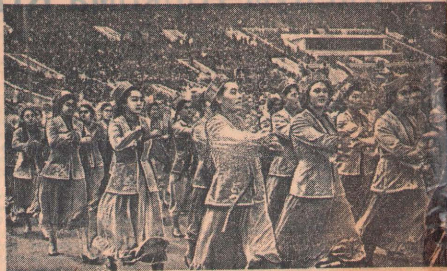
Спартакиада народов СССР. Колонна спортсменов Казахской ССР на торжественном параде участников Спартакиады.