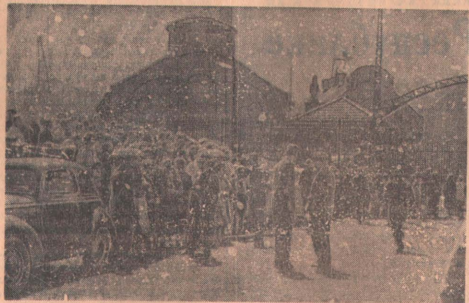
На снимке: у шахты Марсинель в день катастрофы.

Многие бельгийские угольные районы уже наполовину истощены, и в скором времени ряд шахт придется закрыть. Их владельцы—крупные бельгийские капиталисты—не заинтересованы в «непроизводительных расходах» и не хотят оборудовать шахты даже современной вентиляцией, что предотвратило бы в значительной степени частые взрывы гремучего газа. Тем более не желают они модернизи-