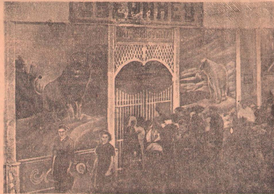
У входа на выставку.