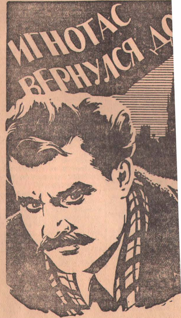
Производство Литовской киностудии, выпуск

ОБЛКИНОПРОКАТ ВЫПУСТИЛ НА ЭКР НОВЫЙ ХУДОЖЕСТВЕННЫЙ ФИЛЬМ