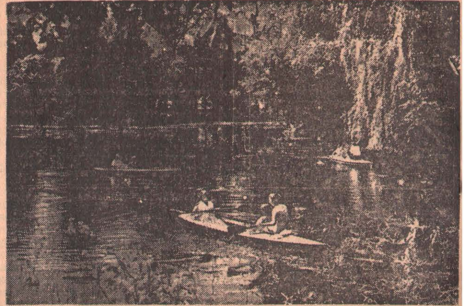
В Польской Народной Республике. Трудящиеся отправляются на время отпусков на курорты, в санатория и дома отдыха.

Нехватка школьных зданий и учителей уже давно стала серьезной проблемой в США. Но до сих пор правительство по существу не принимает мер для исправления положения. На последней сессии конгресса был внесен законопроект, предусматривающий предоставление правительством мизерной помощи штатам и муниципалитетам в строительстве новых школ, но даже этот проект был отклонен. Сенатор от