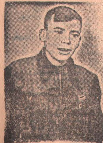
— Цветок душистых прерий...

тах работает молодежь из города Николаева, прибывшая сюда по путевкам комсомола. Коллектив рабочих и руководство стройки надеются, что они сделают все, чтобы зимой людям было уютно жить,—заканчивает т. Кузнецов.