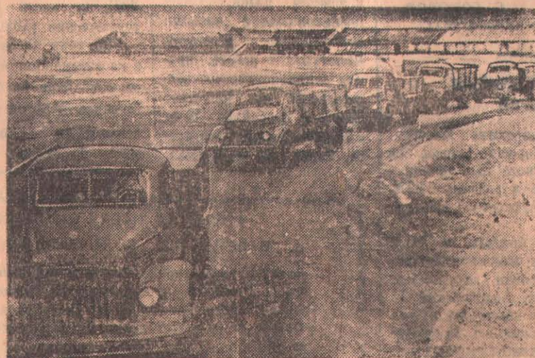
Колонна автомашин направляется с хлебом на элеватор. На совхозном току.

На целин тейчивые зйства, пи, чудес на целине что в сов: дебрались люди, не