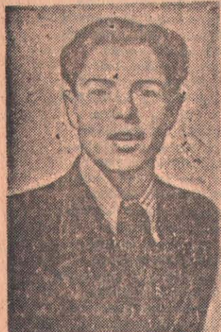
— Где ж ты, ромашка моя...

В октябре надо закончить строительство котельной, сдать детские ясли. На этих объек-