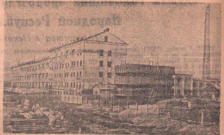
Карагандинская область. Ежегодно растет число пищевых предприятий Караганды. Недавно вступил в строй новый хлебозавод, сооружаются кондитерская фабрика и пивоваренный завод.

Директор так и сделал. Одиннадцатого августа к нашему дому подъехала гружен- ная домашним скарбом машина, ее сопро- вождал тов. Саловой, управляющий сад-