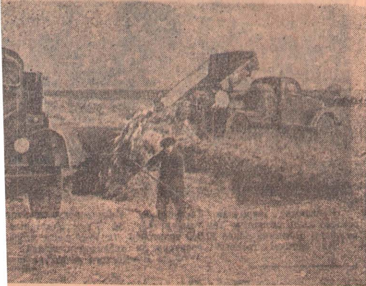
хозартеля им. Вильямса, Мамлютского района, действительно готовятся по плану 21000 центнеров сена они заготовили 26 тыс. центнеров. Сей- нут кукурузный силос. Его будет более 2 тыс. тонн, и в основном работают работники животноводства. лосование кукурузы.