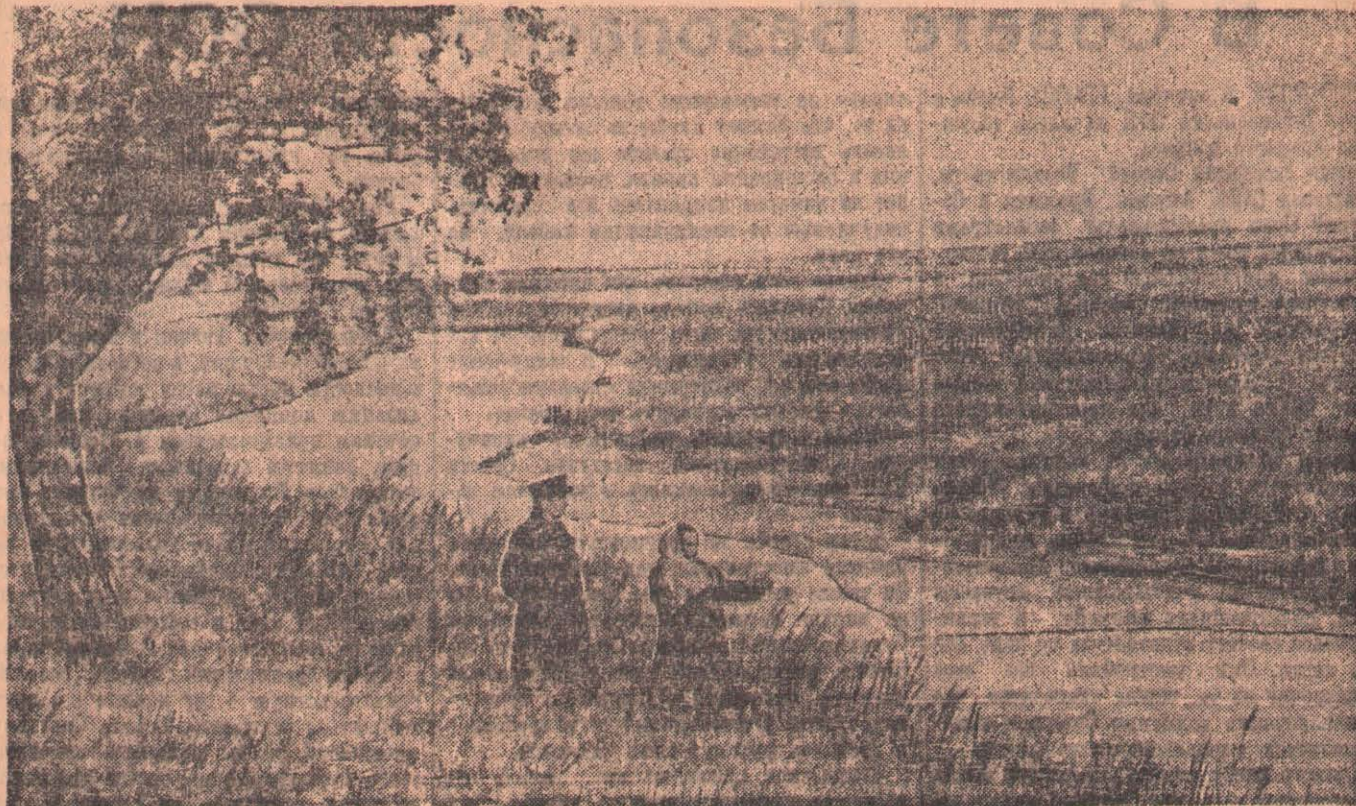
Осень. На берегу Ишима.