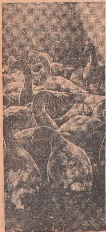
Всеобщее внимание посетителей привлекают гуси птицефермы колхоза «Путь Ленина», Соколовского района. Вес каждой птицы—4 килограмма.

духе по часу, а в ненастную погоду — по 20—30 минут.