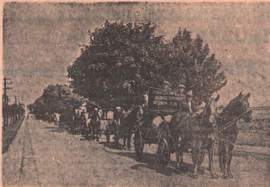
Крестьяне Польской Народной Республики организуют коллективную сдачу зерна государству.

Усиливается народное движение против американских военных баз в Западной Германии. Здесь, как пишет газета «Ней-