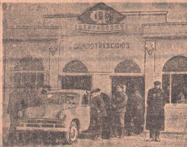
Областная сельскохозяйственная выставка. Слева — павильон «Совхозы», справа — павильон облпотребсоюза.