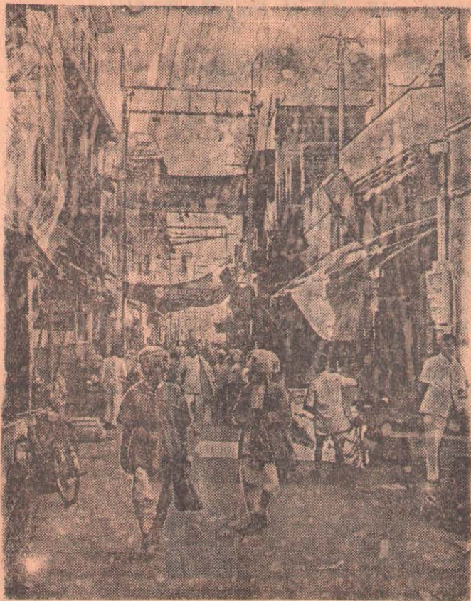
Индия. Улица в го роде Джодхпуре.