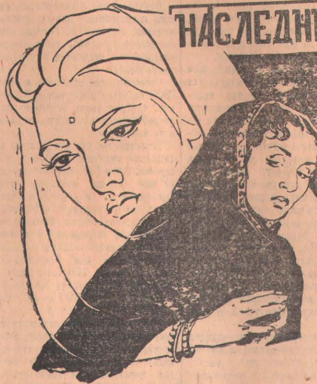
Производство «Минерва-Мувитон», Индия. Выпуск 1956

СЕВЕРО-КАЗАХСТАНСКАЯ ОБЛАСТНАЯ КОНТОРА ПО ПРОИЗВОДСТВУ КИНОФИЛЬМОВ ВЫПУСТИЛА НА ЭКРАНЫ КИНОТЕАТРА Г. ПЕТРОПАВЛОВСКА И ОБЛАСТИ ХУДОЖЕСТВЕННЫЙ