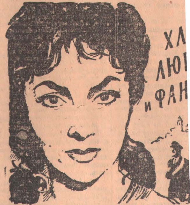
Производство «Титанус», Италия, 1954 г. Фильм дублирован на киностудии им. М. Горького. Выпуск 1956 г.

Северо-Казахстанская областная контора по прокату выпустила на экраны кинотеатров г. Петропавловска художественный фильм