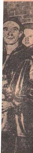
де Пржибра- рех сменил ного месяца ойденная по вого рекорда. агентство.

Финская газета «Тюокансан саномат» пишет, что результаты олимпийских игр превосходны. На играх многократно по-