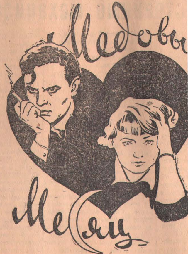
Производство киностудии «Ленфильм», Выпуск 1956 г.

Северо-Казахстанская областная контора по прокату кинофильма на экраны кинотеатров г. Петропавловска и области художественного