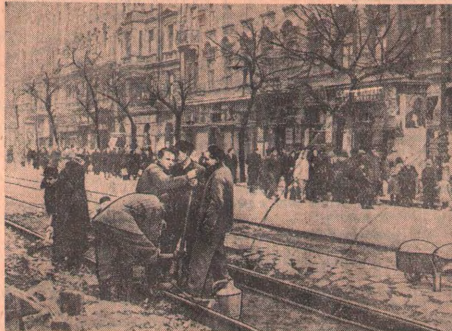
Венгерская Народная Республика. Будапешт сегодня. На снимке: молодежная строительная рабочая бригада восстанавливает трамвайную линию.