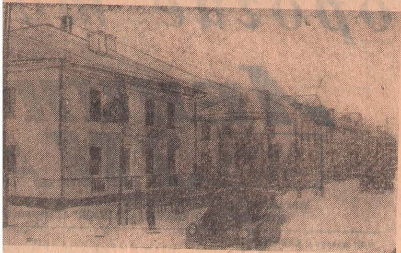
Моторной и Абая.