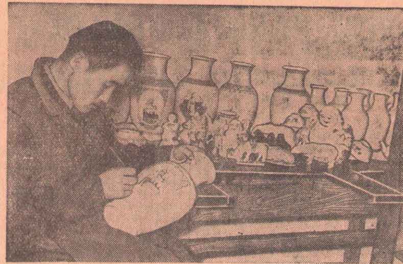
Монгольская Народная Республика. Один из лучших мастеров художественной росписи фарфорового завода в Улан-Баторе Пашко.