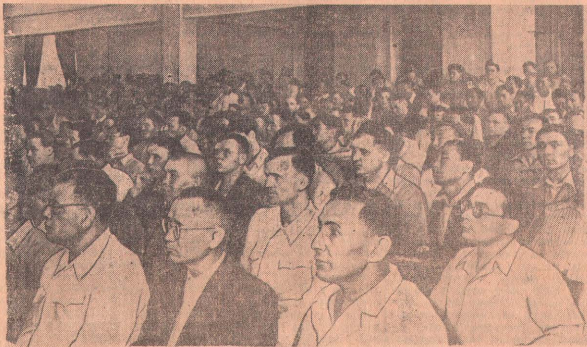
На снимке: зал заседания съезда.