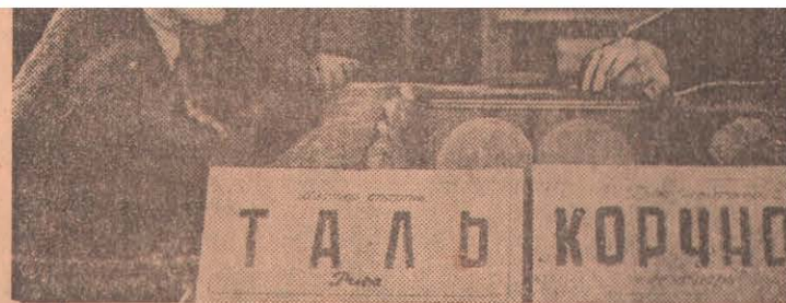
На снимке: лидер турнира мастер спорта М. Таль (Рига) и греной ((Ленинград).

БЕРЛИН, 2 февраля. (ТАСС). Как сообщает агентство АНН, 1-го февраля в Дрездене скончался бывший генерал-фельдмаршал Фридрих Паулюс.