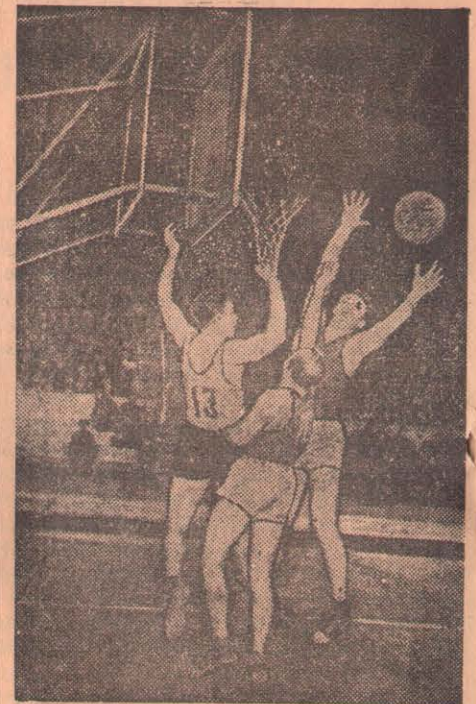
Москва. Соревнования на первенство страны по баскетболу во Дворце спорта Центрального стадиона имени В. И. Ленина.

Очень жаль, что многократные в прошлом чемпионы Казахстана — петропавловские хоккеисты утратили свою славу и не показали слаженной, напряженной игры. Чем это объяснить? Дело в том, что Северо-Казахстанская область выставила для участия в чемпионате самую «старую» команду (средний возраст пятнадцати ее игроков — 29 лет). Очевидно, в Петропавловске и районах области мало готовят молодых способных хоккеистов, слабо популяризируют важный вид зимнего спорта. Не совсем удачным был и подбор игроков в сборную команду. Областному и горно-режскому комитетам по физкультуре и спорту, общему и горному комсомола следует побеспокоиться о развитии хоккейного спорта в Северном Казахстане.