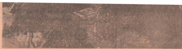
Картина художника Ю. М. Неприщева «Василий Теркин» (Все)

ленинским путем к коммунизму. Он уверен, что дело защиты его героического создательного труда, государственных интересов Родины находится под надежной охраной, что его армия, авиация и флот сумеют нанести уничтожающий удар по любому агрессору, который посмеет посягнуть на честь, свободу и независимость Советской страны.