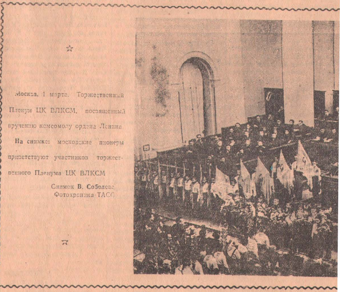
☆ Москва, 1 марта. Торжественный Пленум ЦК ВЛКСМ, посвященный вручению комсомолу ордена Ленина. На снимке: московские пионеры приветствуют участников торжественного Пленума ЦК ВЛКСМ.