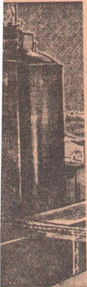
ла промышленные цементные ки. Пятилетний еличение роста