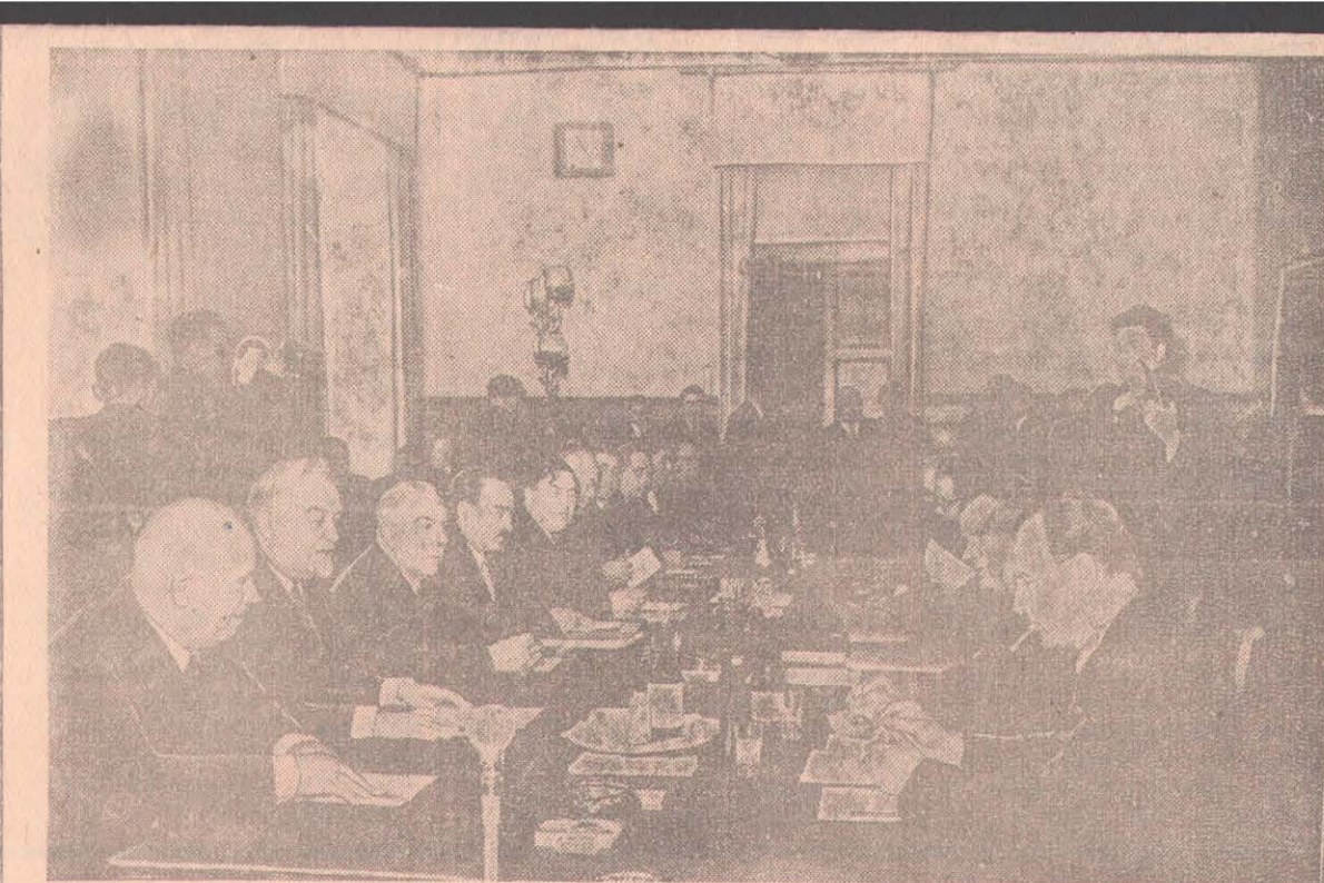
Москва, 21 марта. Начались переговоры между делегациями Советского Союза и Венгерской Народной Республики. На снимке: во время переговоров.

Нет в хозяйстве и твердого графика откорма и сдачи свиней государству. Как заявил тов. Дмитриев, всех свиней, которые содер-