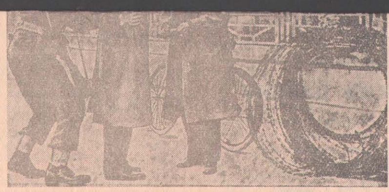
К положению на острове Кипр. Вооруженные английские солдаты задерживают на улицах Никозии прохожих и производят обыски. На снимке: обыск юноши на улице Никозии.

Она пробудет в Тегеране четыре дня и затем вылетит в Карачи. ▲ Вчера в Рангуне закончила свою работу всебирманская конференция сторонников мира. В принятых резолюциях конференция выступила за ликвидацию СЕАТО и Багдадского военных пактов и призвала Таиланд, Пакистан и Филиппины присоединиться к другим странам Азии и Африки в деле заключения пакта коллективной безопасности. Конференция высказалась за использование атомной энергии только в мирных целях и обратилась к великим державам с призывом найти пути к разоружению. 24 марта. (ТАСС).