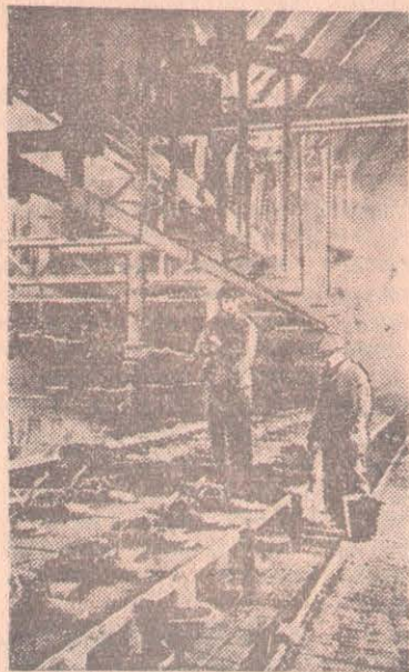
Польская Народная Республика. Варшава. В цехе газового завода.