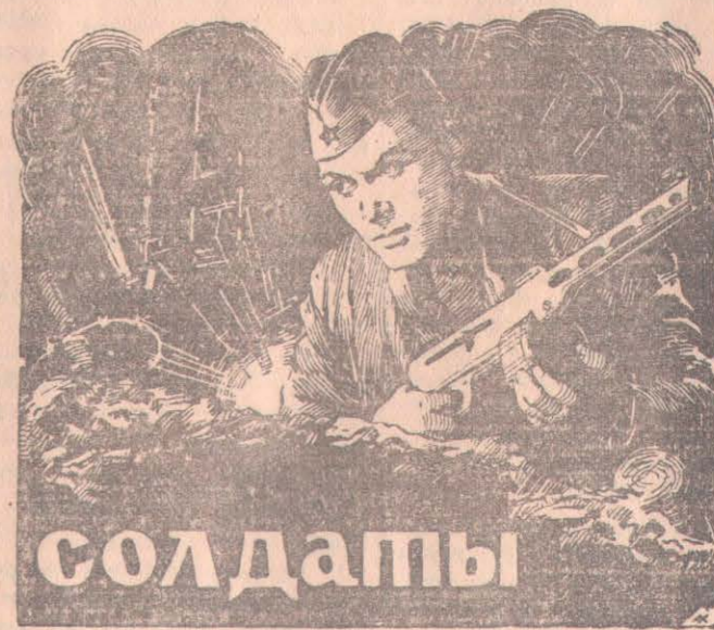
Производство киностудии «Ленфильм». Выпуск 1957 г.

Областная контора по прокату кинофильмов выпускает на экраны города и области новый художественный фильм