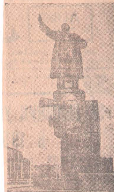
Ленинград. Памятник В. И. Ленину у Финляндского вокзала.

Предложение этот человек был бы не политиком и интуитивом.