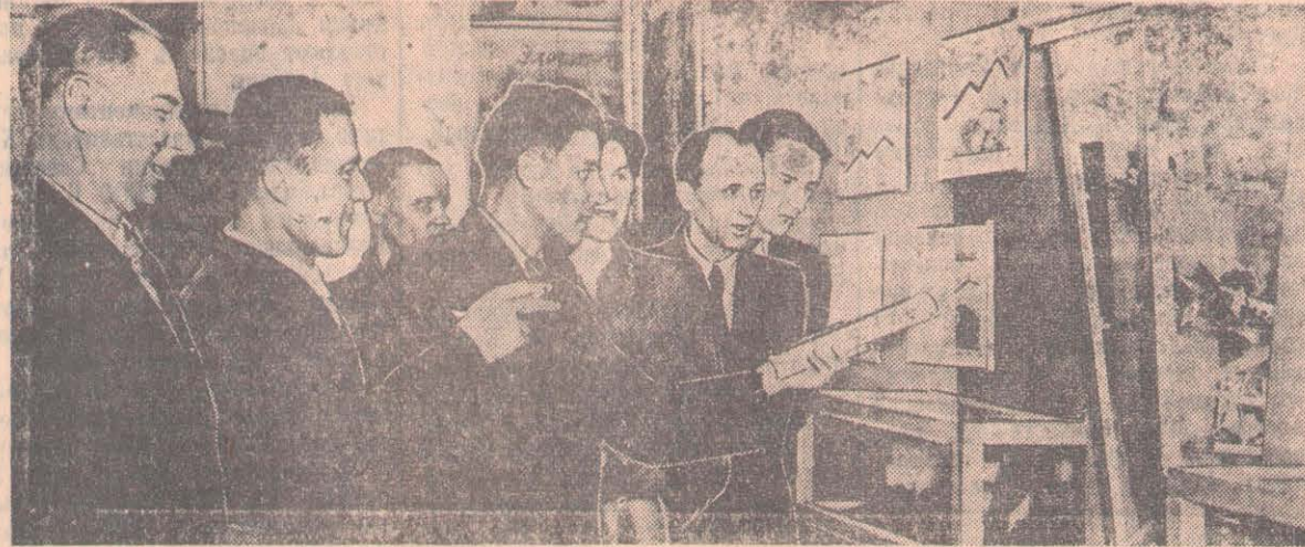
На снимке: делегации Кургана и Омска у стенда выпускаемой продукции Петропавловским мясоконсервным комбинатом им. Микояна.

Следует пересмотреть и нормы выработки, которые в большинстве случаев являются опытно-статисти-