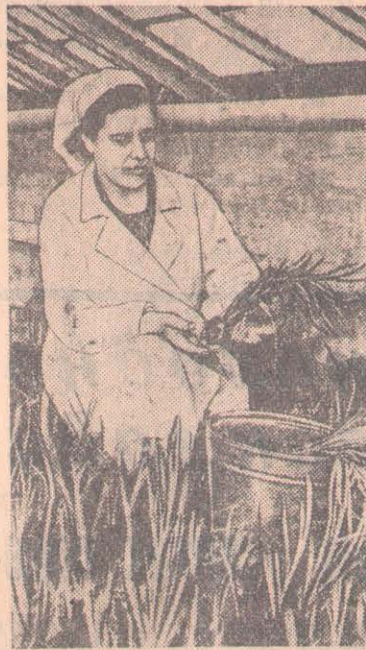
В теплице Петропавловского колхоза «Луч Ленина» выращиваются различные овощи для трудящихся города. Сейчас ведется сбор первых зеленых овощей.

В. КАЗАНЦЕВ. Редактор районной газеты «Сталинское знамя».