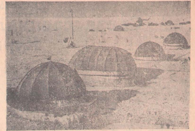
Дрейфующая научно-исследовательская станция «Северный полюс-6».

НЬЮ-ЙОРК, 4 апреля. (ТАСС). Пытаясь оправдать проводимые США программы «помощи» иностранным государствам, подвергающиеся критике внутри страны, обозреватель газеты «Нью-Йорк геральд трибюн» Липман разъясняет читателям, что, изымая ежегодно около 4 миллиардов долларов из американского национального дохода, США расходуют эти средства отнюдь не на повышение уровня жизни других стран. Дело в том, пишет он, что «фактически все эти средства расходуются для того, чтобы поддерживать и сохранять возглавляемую США большую военную коалицию, окружающую Советский Союз и красный Китай». Пора перестать обманывать самих себя, думая, будто США проводят широкую программу содействия развитию слабо-