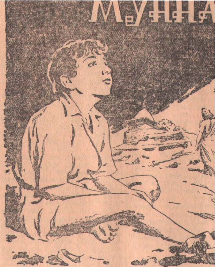
(По произведению Мохан Валли) Производство «Найя Сансар», Индия. Выпуск 1957 г.

Величественная программа мирного созидания, намеченная Коммунистической партией Китая на вторую пятилетку, несомненно, будет выполнена китайским народом, богатейшие творческие силы которого все полнее раскрываются день ото дня.