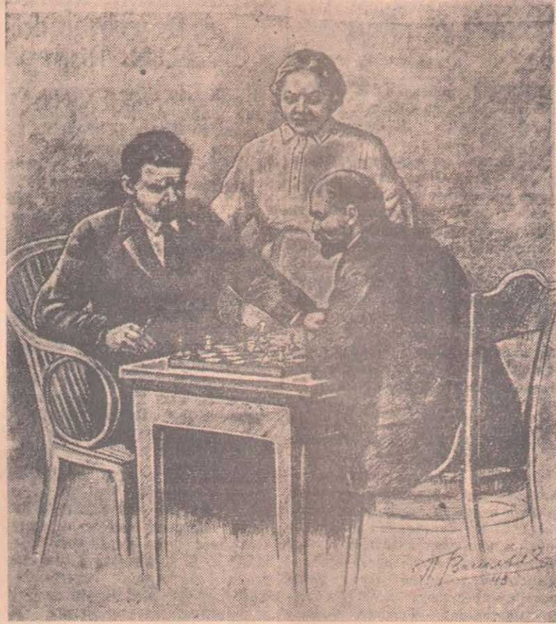
В. И. Ленин, А. М. Горький и Н. К. Крупская. Рисунок художника П. Васильева.