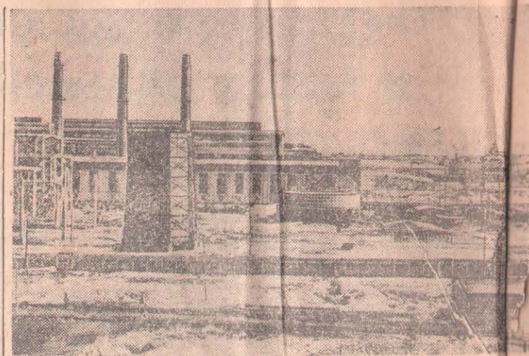
Польская Народная Республика. Строительство крупнейшего сталургического завода качественных сталей на окраине Варшавы.

Выступая в поддержку доклада большинства, историк Эдвард Рот-