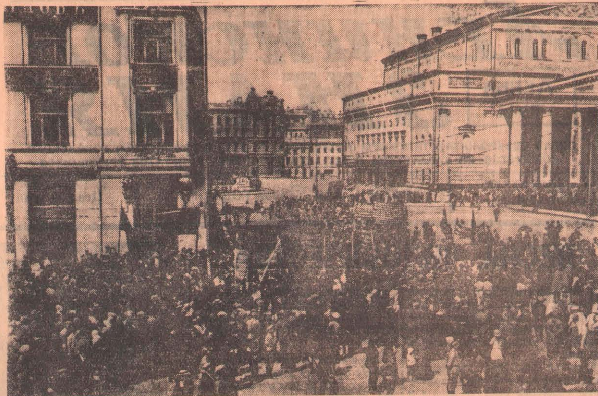
Москва, 1917 год. Первомайская демонстрация на Театральной площади. (Из материалов Центрального государственного архива кино-фото-фонодокументов СССР).