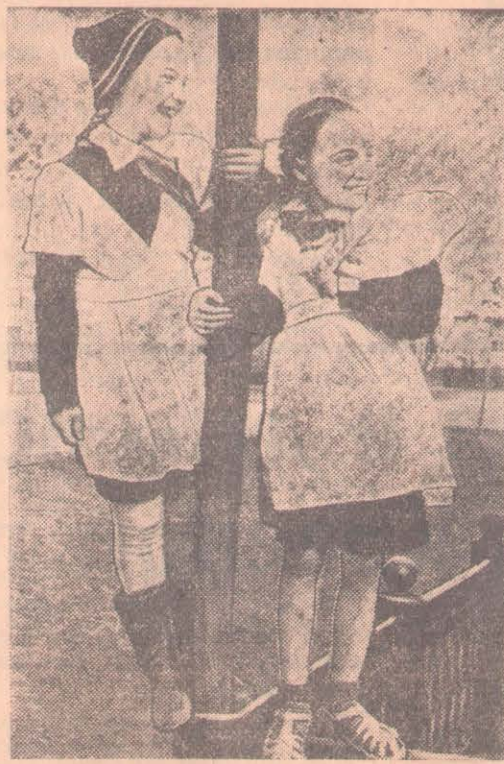
1. «Сколько интересного в колонне!».

Многотысячные первомайские демонстрации состоялись в Тбилиси, Бриване, Ашхабаде, Сталинабаде, Фрунзе, Кишиневе. В Таллине праздничное шествие было отменено в связи с плохой погодой. Миллионы