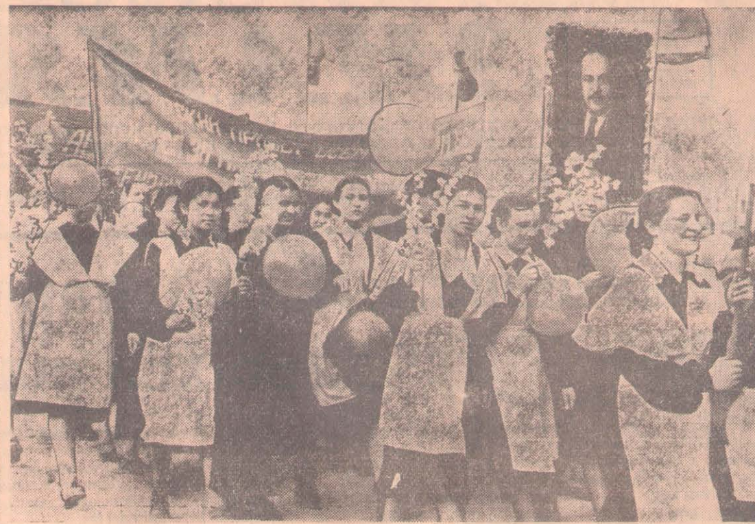
2. На первомайской демонстрации в г. Петропавловске