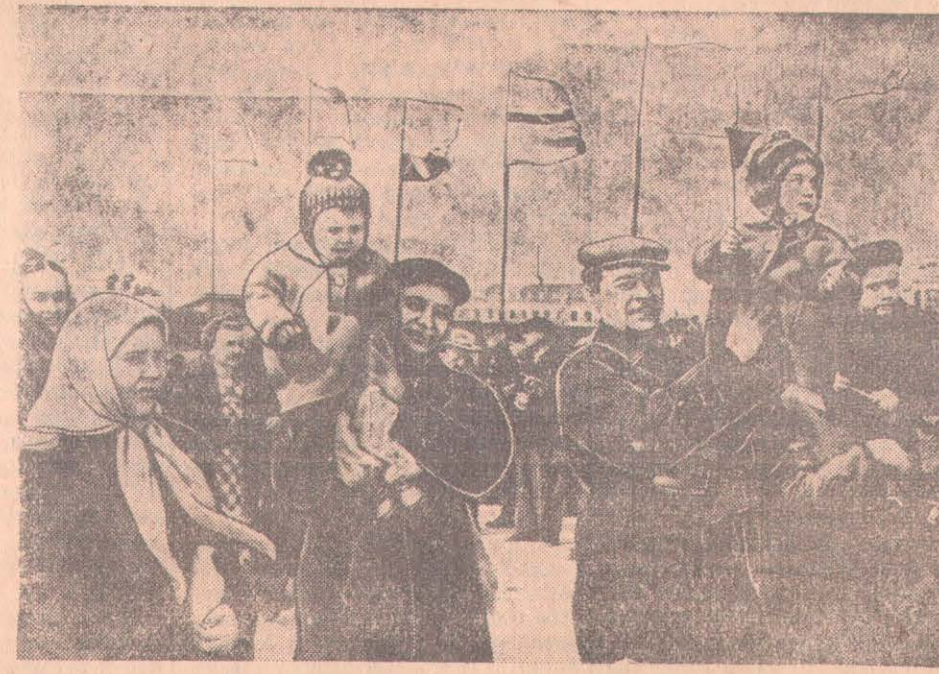
На Первомайской демонстрации в г. Петропавловске