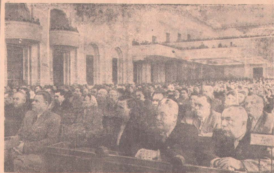
Москва, Большой Кремлевский дворец. VII сессия Верховного Совета СССР IV созыва. Заседание Совета Союза Верховного Совета СССР 7 мая 1957 года.